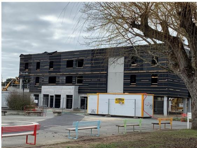
PROJET CREATION POLE BEACH ILE DE RE